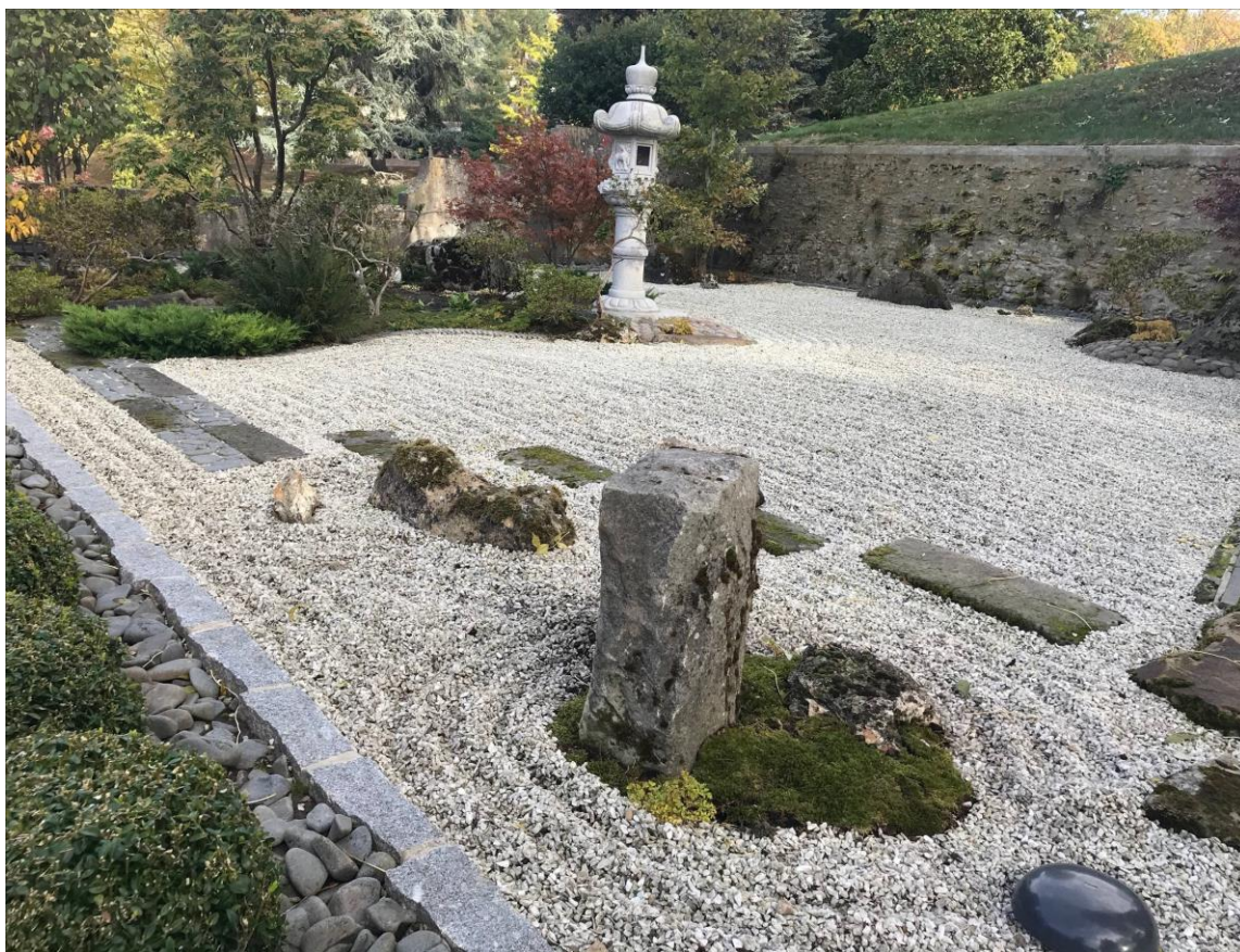
モナコ日本庭園 弊社設計・施工