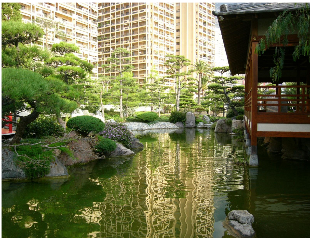
モナコ日本庭園 弊社設計・施工